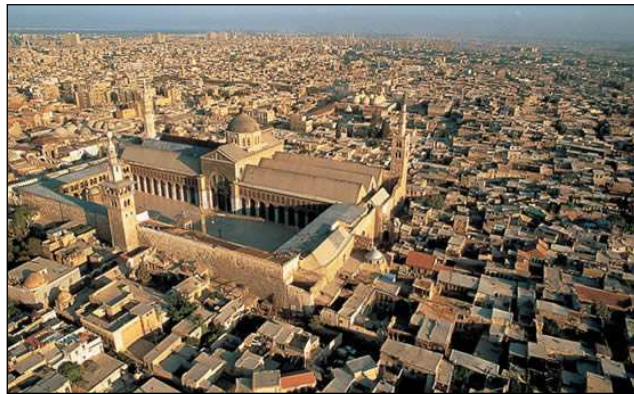
La Gran Mezquita de los Omeyas.

Presentación en el aeropuerto 2 horas antes de la hora de la salida del avión. Embarque en vuelo regular, clase económica con destino a Damasco. Llegada, asistencia, obtención del visado y traslado al hotel elegido. Cena y alojamiento.