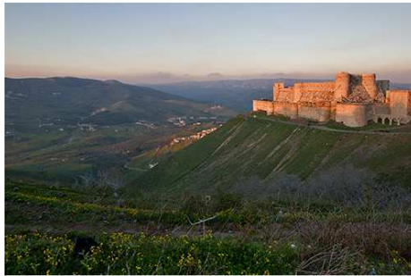
Crac de los Caballeros

continuación hacia el imponente castillo de los caballeros cruzados, mezcla de varias arquitecturas llevadas a cabo a través de tiempo y sus diferentes moradores. Almuerzo opcional y salida tomando la carretera de la costa siria visitando el castillo de Marqab y pasando por la bella localidad mediterránea de Tartus para llegar más tarde a la capital del mediterráneo sirio en la ciudad de Latakia. Cena y alojamiento.