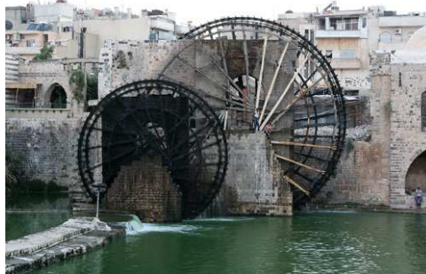
Las Norias en Hama

Desayuno. Visita panorámica de Latakia y continuación hacia Ugarit donde inventaron los fenicios el primer alfabeto de la Historia. Después de atravesar la cadena montañesa de la costa, visita del castillo de Saladino, ejemplo de la arquitectura de la época de los cruzados y el estilo la arquitectura islámica de la época de Salah Eddin, el caudillo que acabó con la ocupación de los cruzados. Almuerzo opcional y continuación hacia la antigua Hama, la capital de las Norias. Cena y alojamiento.