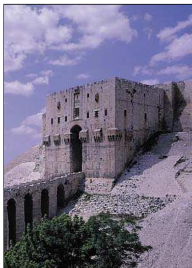
Ciudadela de Alepo.

Desayuno. Visita de las centenarias norias sobre el río Orontes y continuación hacia los restos arqueológicos de la localidad greco-romana para visitar sus enormes columnatas para proseguir hacia Serjella, ejemplo de las ciudades muertas en el norte de Siria. Llegada por la tarde la segunda capital de Siria. Cena y alojamiento en Alepo.