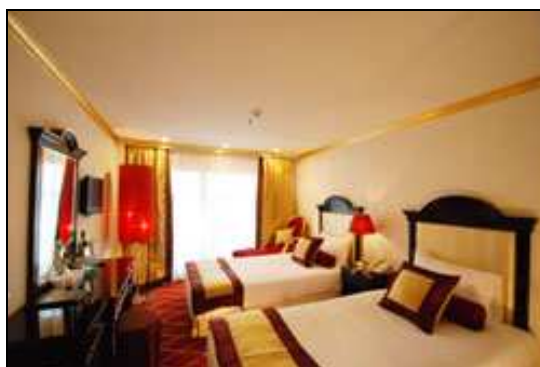
Cabina Crucero Opera 5* Lujo

Desayuno. Salida guiada para efectuar visita incluida a las pirámides y la esfinge. Resto del día libre. Alojamiento.